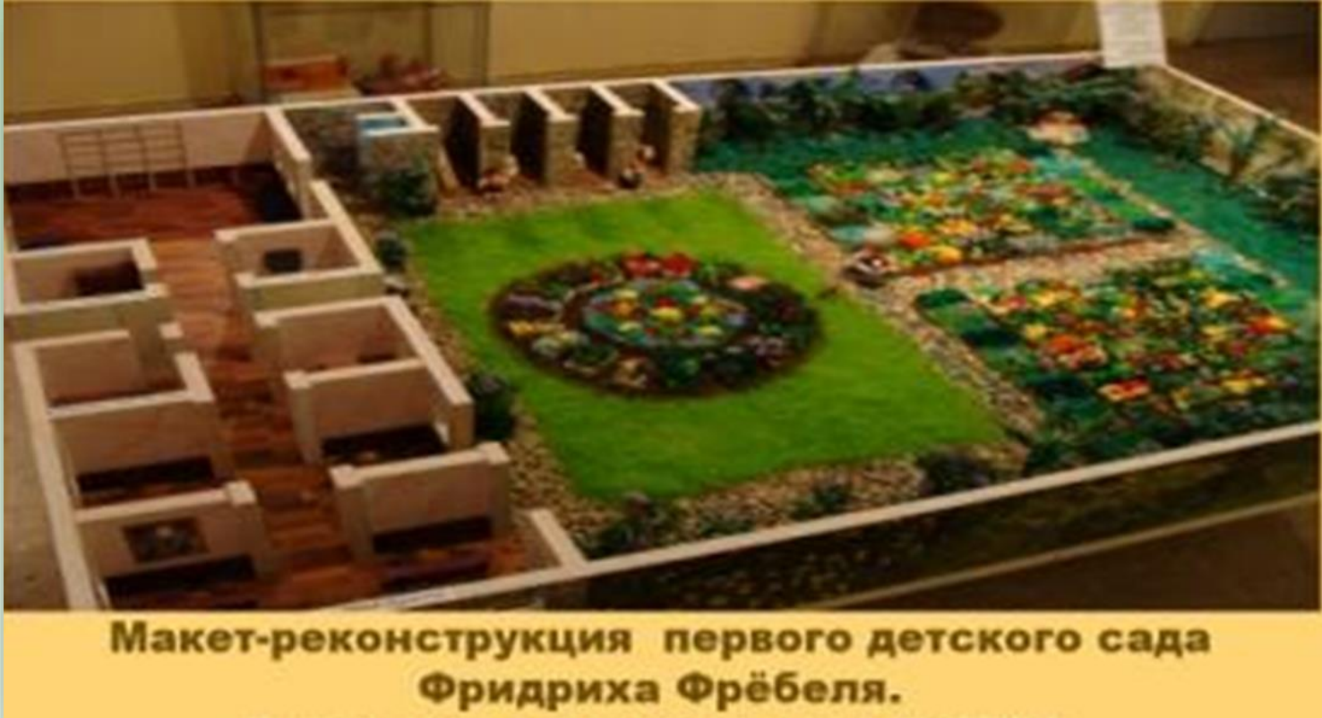
Макет-реконструкция первого детского сада Фридриха Фрёбеля.

ФРИДРИХ ФРЁБЕЛЬ СОЗДАЛ ПЕРВЫЙ В МИРЕ ДЕТСКИЙ САД И ДИДАКТИЧЕСКУЮ СИСТЕМУ ПО РАБОТЕ С ДЕТЬМИ ДОШКОЛЬНОГО ВОЗРАСТА